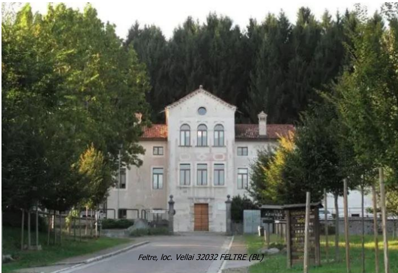
Feltre, loc. Vellai 32032 FELTRE (BL)

Istituto Tecnico Agrario Istituto Professionale Agrario Formazione Professionale